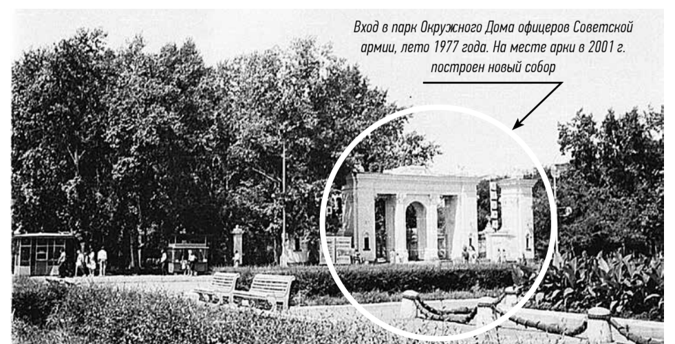
Вход в парк Окружного Дома офицеров Советской армии, лето 1977 года. На месте арки в 2001 г. построен новый собор